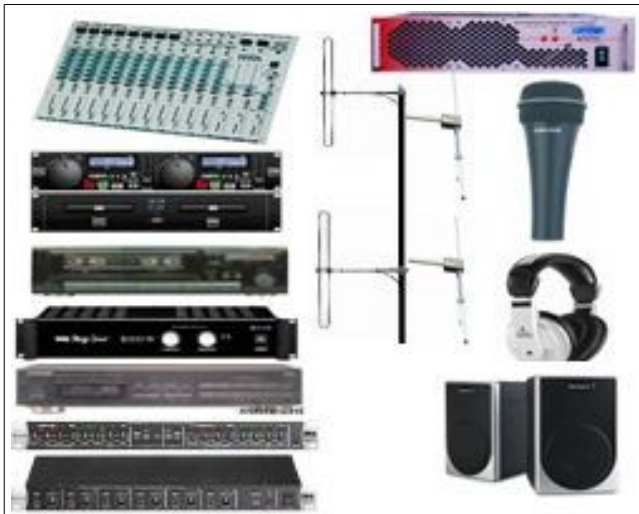
PACK-RADIO-BFM-03 STATION 500W