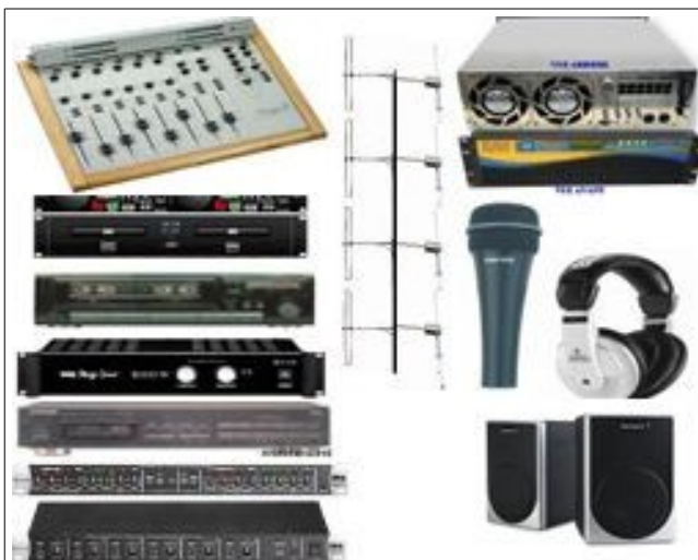
PACK-RADIO-BFM-04 STATION 1000W