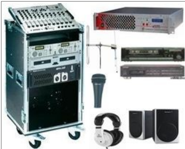
PACK-RADIO-BFM-05 STATION MOBILE 100W