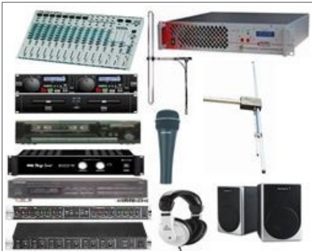
PACK-RADIO-BFM-02 STATION 100W