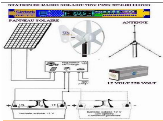
PACK-RADIO-BFM-06 RADIO SOLAIRE 70W