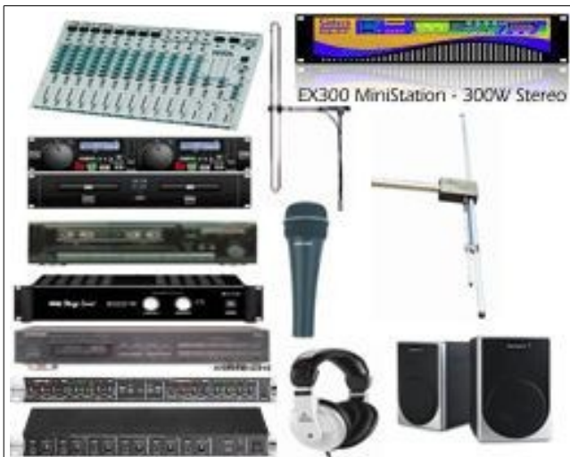
PACK-RADIO-BFM-02 STATION 250W