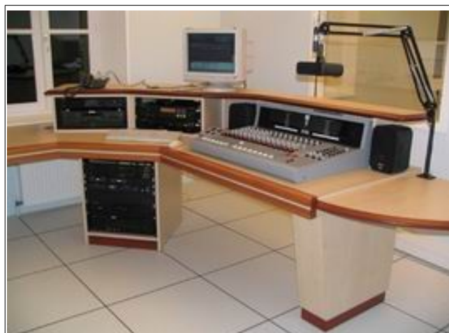
HOME STUDIO équipements d'enregistrements