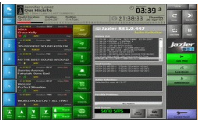
PACK-LOGICIEL SIMPLEPACK RADIO&WEB PLA2